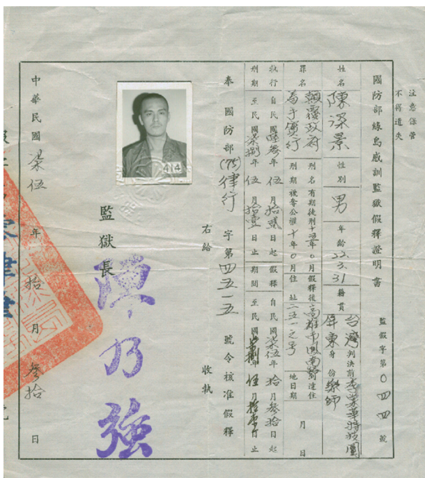
陳深景的假釋證明書。